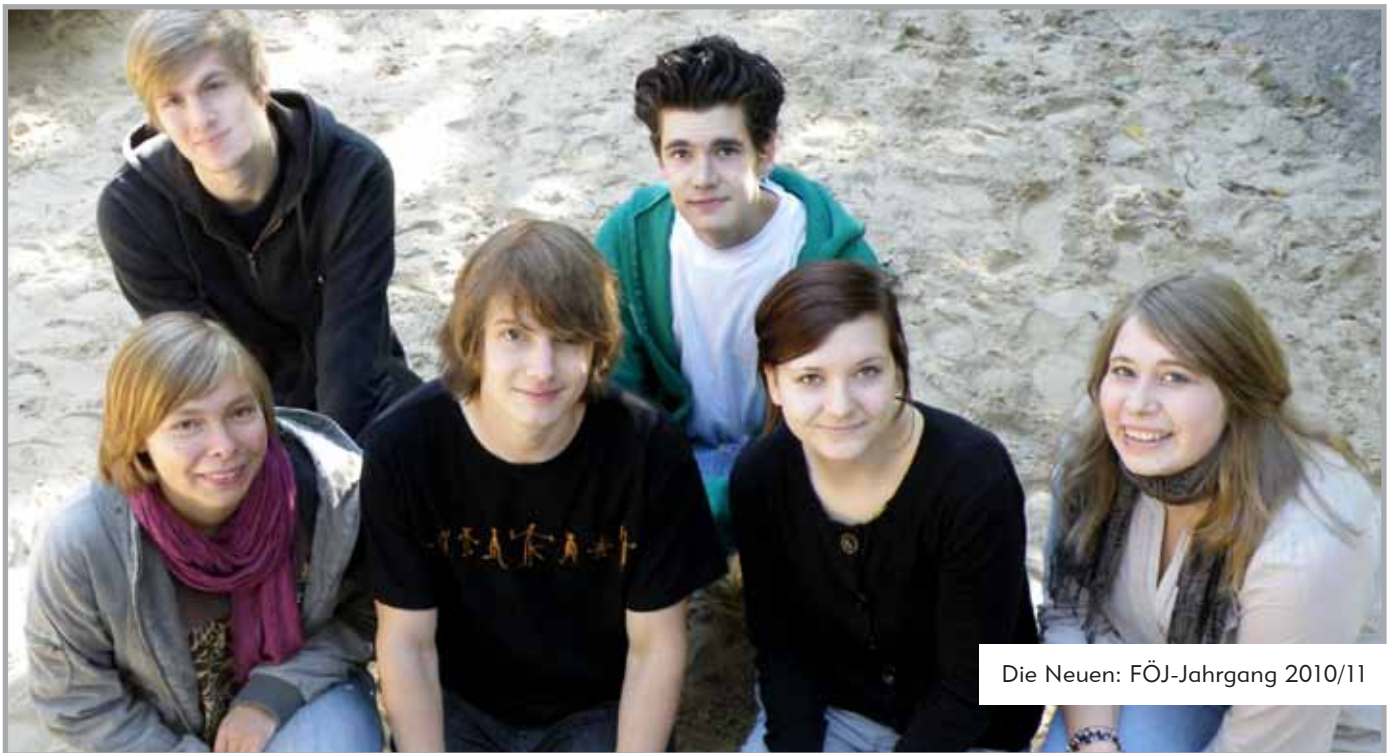
Die Neuen: FÖJ-Jahrgang 2010/11