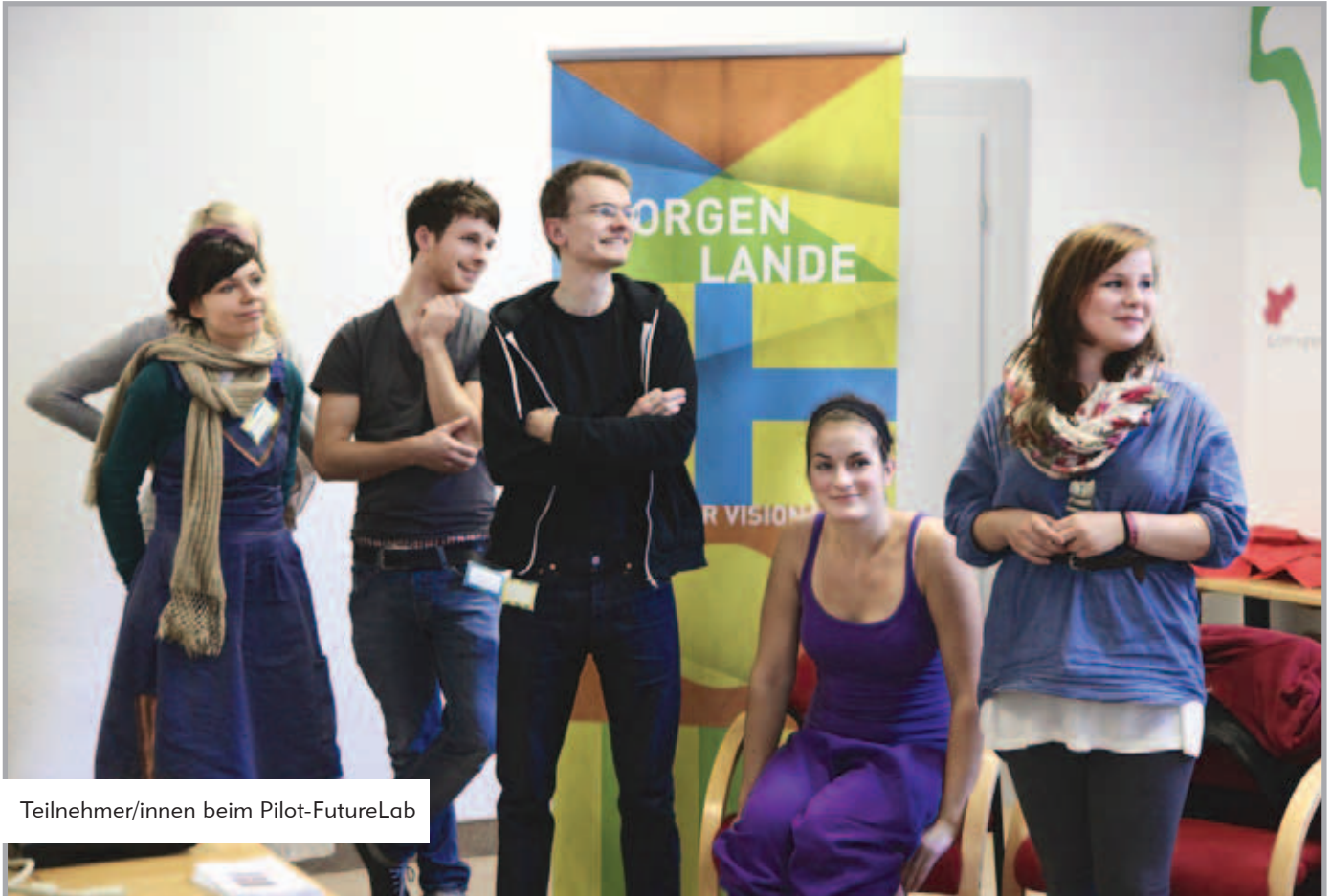
Teilnehmer/innen beim Pilot-FutureLab

2010 wurde mit MORGEN LANDE ein weiteres neues Projekt der BUNDjugend entwickelt und bewilligt. Ziel des Projektes ist es, eine Sensibilisierung von Jugendlichen für Gerechtigkeitsfragen, Globalisierung und Umweltschutz zu erreichen und nachhaltig zu fördern. Die BUNDjugend möchte damit vor allem Jugendliche ansprechen, die bisher kaum oder gar nicht mit Fragen rund um das Thema nachhaltiger Konsum in Berührung gekommen sind. Förderer des Projektvorhabens sind das Ministerium für Umwelt, Naturschutz und Reaktorsicherheit (BMU) und das Umweltbundesamt (UBA).