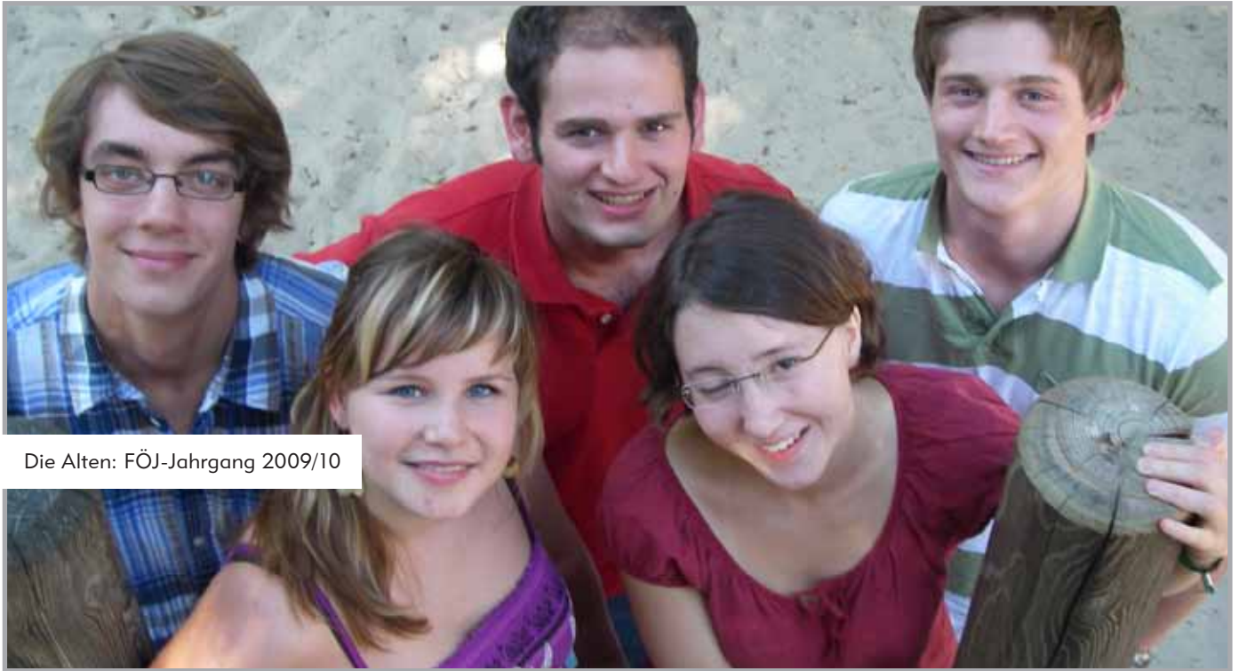
Die Alten: FÖJ-Jahrgang 2009/10