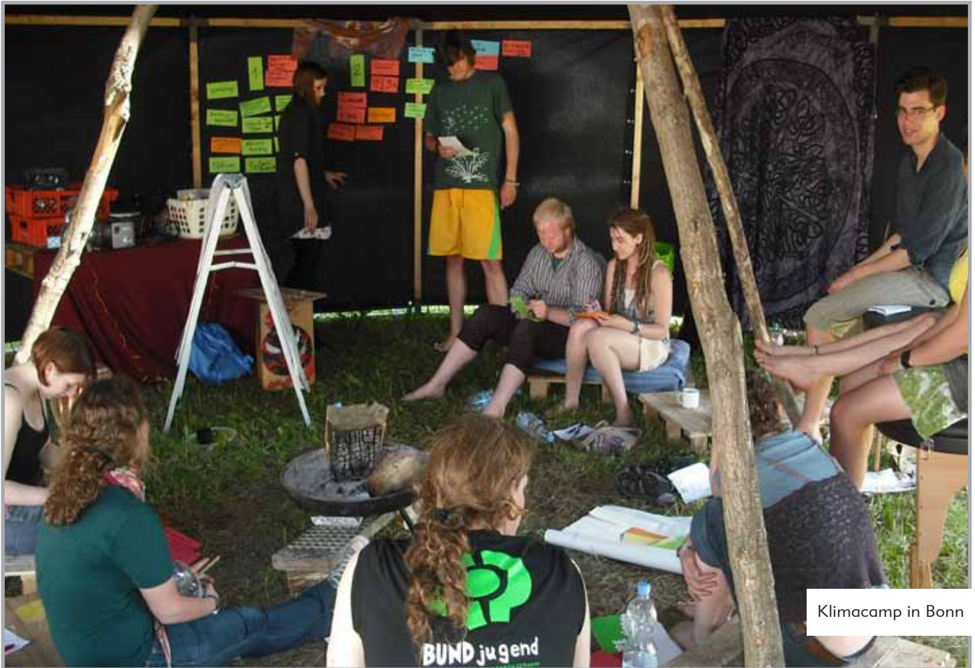
Klimacamp in Bonn

Im Juni gingen die UN-Klimaverhandlungen in Bonn mit den sog. „Intersessionals“ (also Treffen zwischen den großen Weltklimagipfeln) in die nächste Runde. Da die große Klimakonferenz 2010 in Mexiko stattfand, nutzte die Klimabewegung diesen Termin, um nach „Flophenhagen“ für ambitionierte Klimaschutzziele zu demonstrieren.