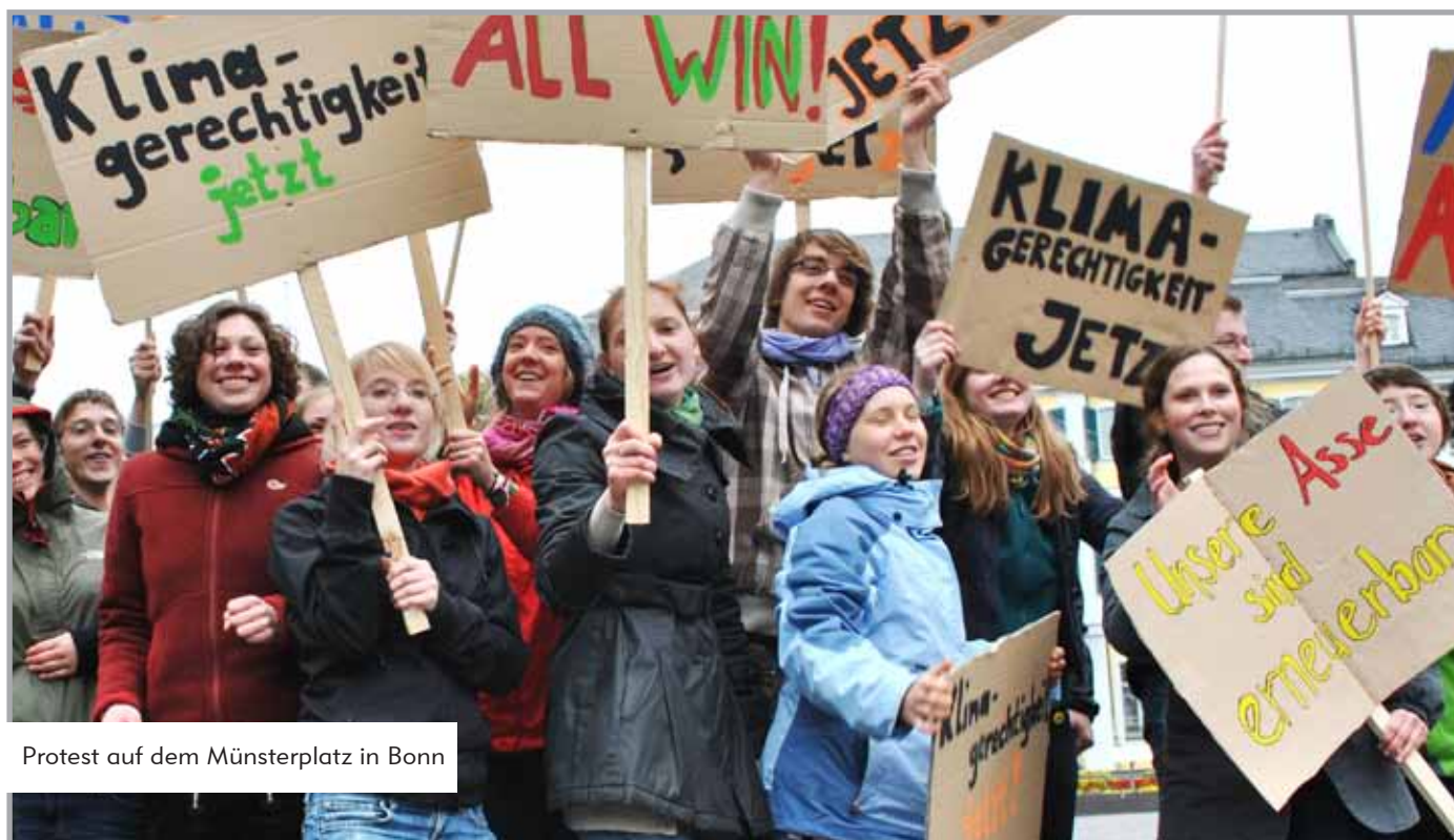
Protest auf dem Münsterplatz in Bonn

Jugendliche, um bei der Aktion mitzumachen und die Passanten in der Fußgängerzone schauten ebenfalls neugierig zu. Obwohl die Klimapoker-Aktion eine der wenigen Aktionen rund um das Treffen blieb, waren nur wenige Pressevertreter/innen vor Ort. Nach der Aktion stand dennoch eines fest: Die gebastelten Materialien laden ein, diese Aktion demnächst nochmal zu wiederholen und so noch mehr Menschen zu zeigen, dass wir im Klimapoker nur gewinnen können, wenn wir alle „all-in“ gehen und uns bewegen.