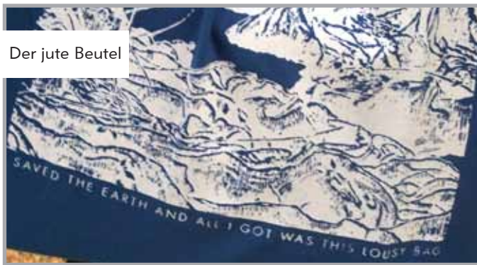
Der jute Beutel

Auch die neue Webseite, die im Herbst 2009 früher als erwartet online gehen musste, wurde weiterentwickelt. Dabei entstanden neue Einträge, Rubriken und verbesserte Übersichten, sowie ein Online-Shop, in dem nun bequem über ein Bestellformular Materialien aus der Bundesgeschäftsstelle geordert werden können. Verkaufsschlager zum Jahresende war der Jutebeutel: „I saved the earth and all I got was this lousy bag“.