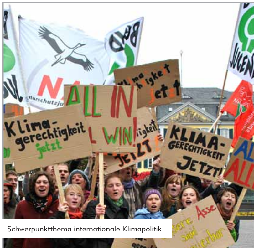
Schwerpunktthema internationale Klimapolitik