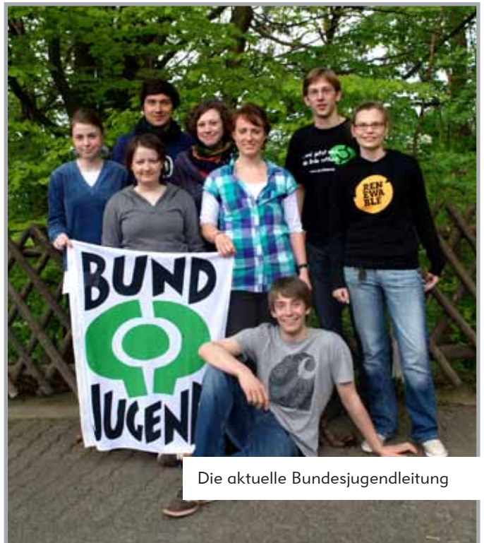
Die aktuelle Bundesjugendleitung