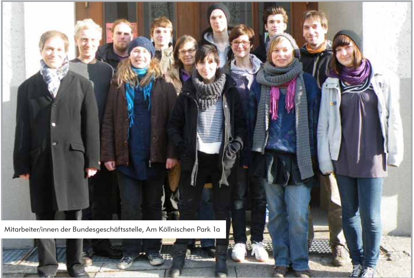
Mitarbeiter/innen der Bundesgeschäftsstelle, Am Kölnischen Park 1a

In der Bundesgeschäftsstelle der BUNDjugend waren zum Jahresende 2010 acht Mitarbeiter/innen beschäftigt, die von sechs Freiwilligen im Ökologischen Jahr unterstützt wurden.