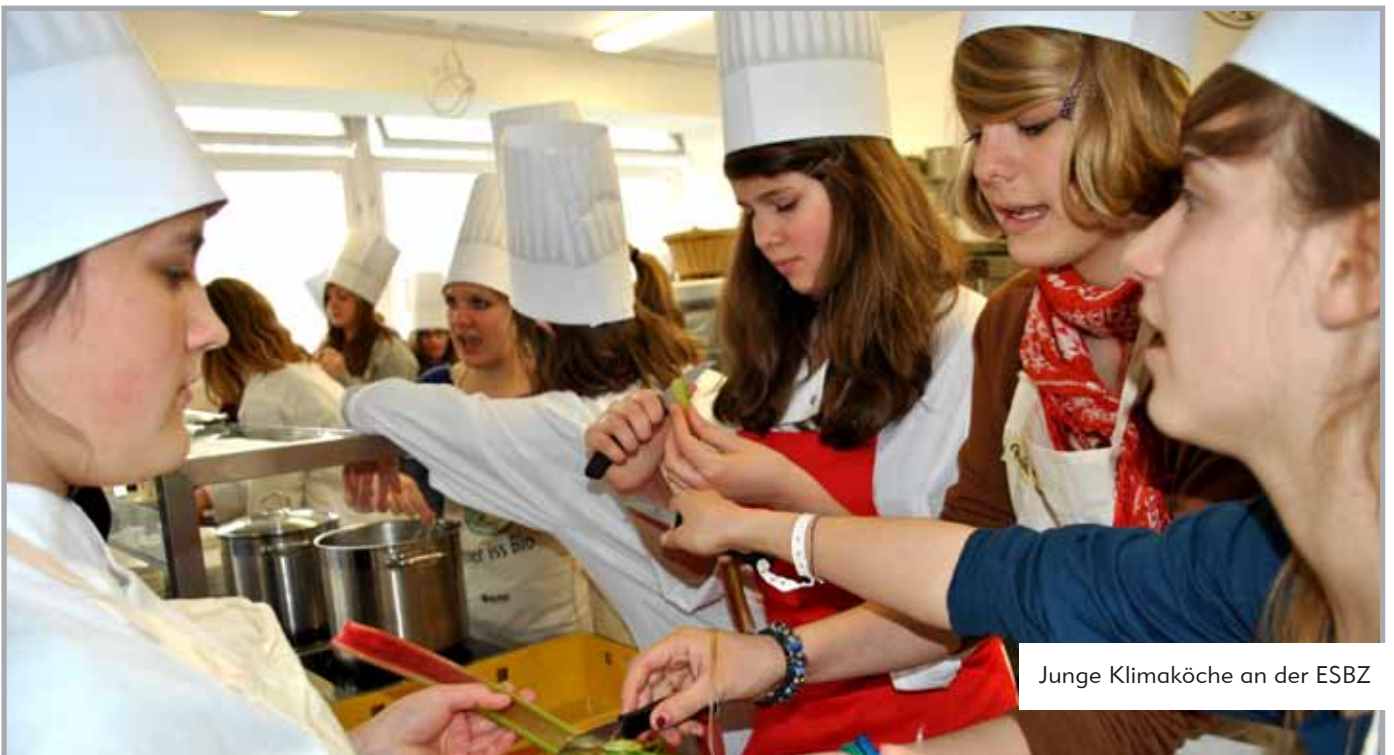
Junge Klimaköche an der ESBZ