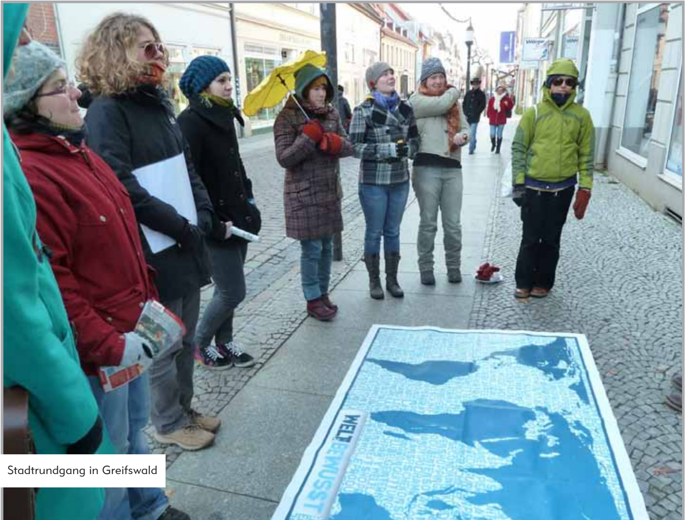
Stadtrundgang in Greifswald

tigten das Projekt bei den bereits aktiven Gruppen und boten die Gelegenheit, sich bundesweit zu vernetzen und gemeinsame Anliegen zu besprechen.