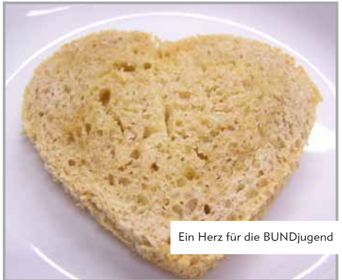
Ein Herz für die BUNDjugend

Inhaltlich gab es einen interessanten Vortrag vom Ecolog-Institut zu verschiedenen gesellschaftlichen Zielgruppen. Angeregt diskutierten die Teilnehmer/innen zu welchen Zielgruppen sie sich zählen würden und welche neuen Zielgruppen für die BUNDjugend relevant sein könnten.