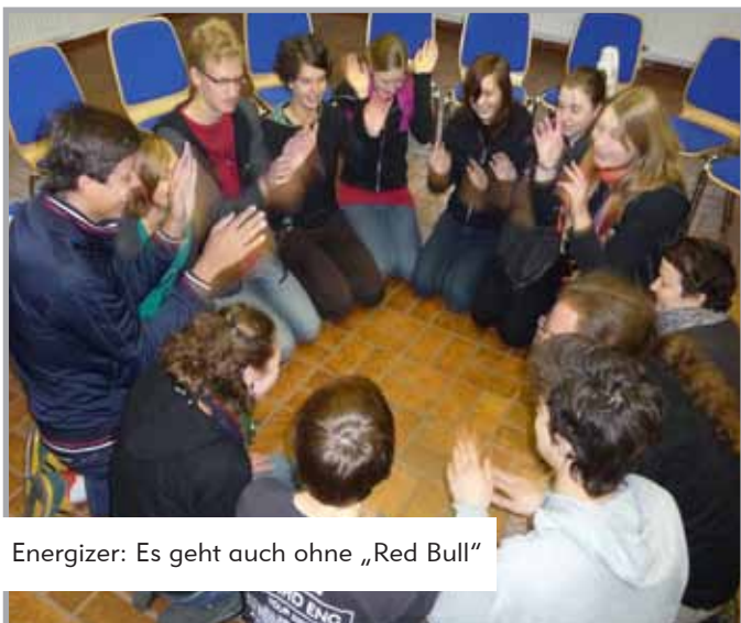
Energizer: Es geht auch ohne „Red Bull“

Freitagabend ging es gleich mit einer spannenden, digitalen Nachtwanderung los. Auf der Jagd nach verschlüsselten Hinweisen für die weiteren Streckenpunkte ging es in Gruppen mit Taschenlampe und GPS-Gerät quer durch den Wald. Am Ende wartete ein Schatz, der jedoch erst von ganz Hartnäckigen am nächsten Abend geborgen werden konnte. Genauso viel Bewegung gab es beim Castor-Aktionstraining. Die Teilnehmer/innen lernten kurz vor den Castortransporten 2010, sich in Bezugsgruppen zu organisieren, übten das Sitzenbleiben auf der Straße und versetzten sich in die Rolle der tragenden Polizist/innen.