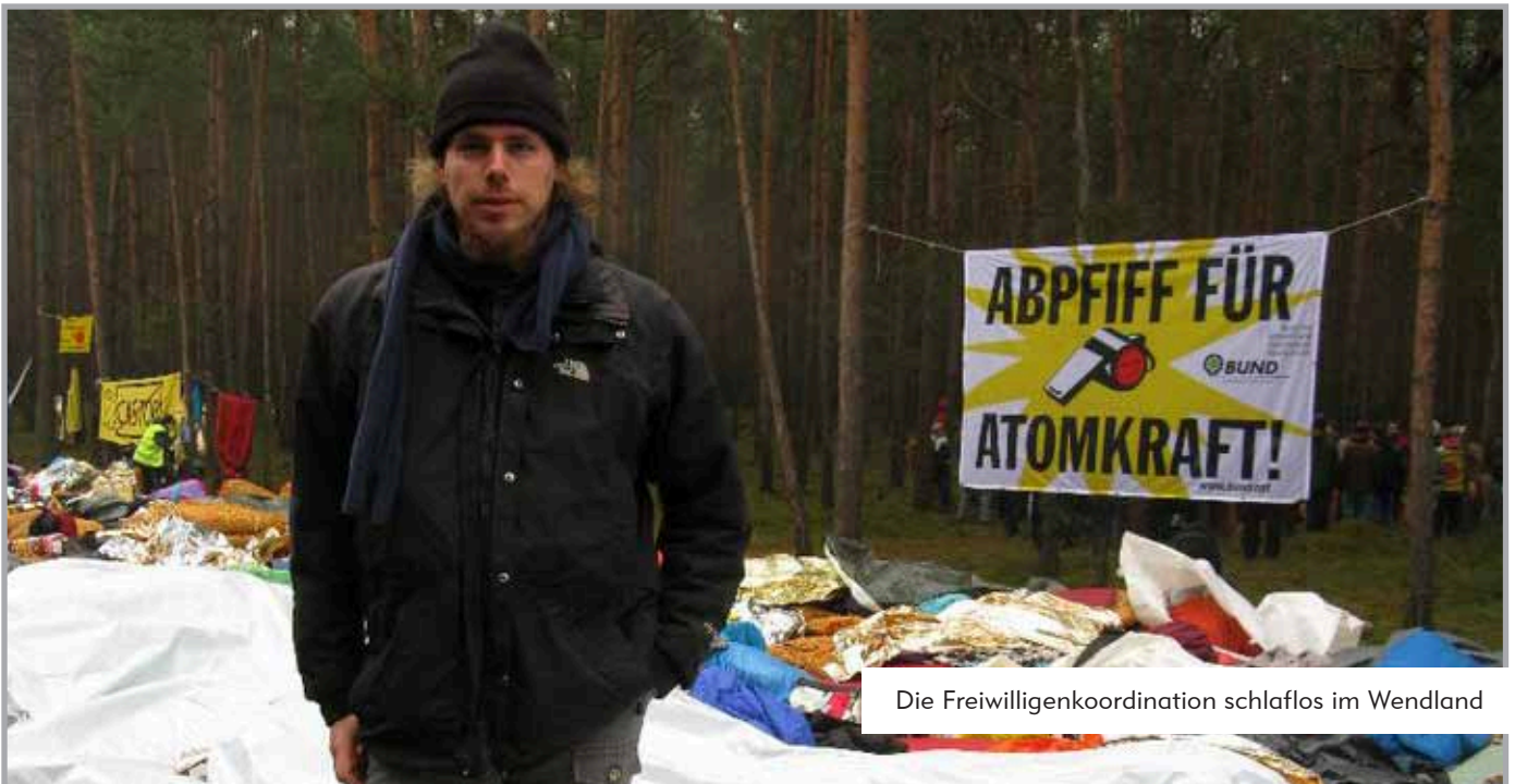
Die Freiwilligenkoordination schlaflos im Wendland