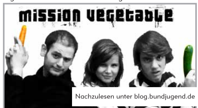
Nachzulesen unter blog.bundjugend.de

Besonders imposant war die Reaktion auf Mission Vegetable , ein Projekt, das drei FÖJler aus der BGSt initiierten. „Die Politiker scheinen in Sachen Klima zu schlafen – wir nicht!“ dachten sich die FÖJler und starteten einen Selbstversuch. Sie wollten die Fastenzeit von Mitte Februar bis Ende März nutzen, um sich acht Wochen lang ausschließlich vegan zu ernähren und damit ein Zeichen setzen: „Wir fangen bei uns an, etwas zu tun – jetzt seid auch ihr dran!“ Auf dem BUNDjugend-Blog ( blog.bundjugend.de ) luden sie alle ein, mitzumachen und berichteten von ihren Erfahrungen und den neuen täglichen Herausforderungen: Vegan?! – Was ist das? Kann man wirklich so leben? Wird man davon nicht schlapp und krank? Sie bekamen viel Zuspruch für ihr Engagement und wurden sogar von einem echten veganen Sternekoch zum Essen eingeladen.