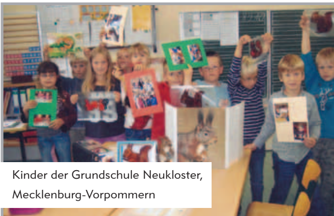
Kinder der Grundschule Neukloster, Mecklenburg-Vorpommern

Der Naturtagebuch -Gedanke wurde auch 2010 wieder vielfältig und kreativ umgesetzt. Neben Kunstwerken, wie Kastanienwäldern aus Pappmaschee, aus Holz gefertigte, ausgesägte Kirschbaumumschläge oder ein mit Fensterfarben angefertigtes Eichhörnchen-Mobile, begeisterten die Jury wie jedes Jahr die intensiven Beobachtungen und