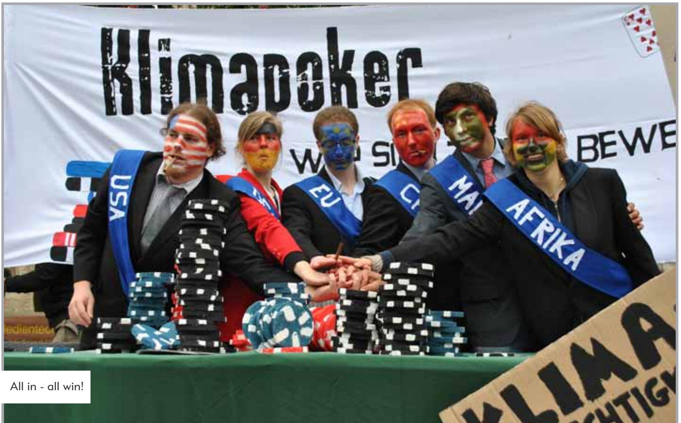
All in - all win!

Aufgrund der breiten Mobilisierung kamen mehr als 40