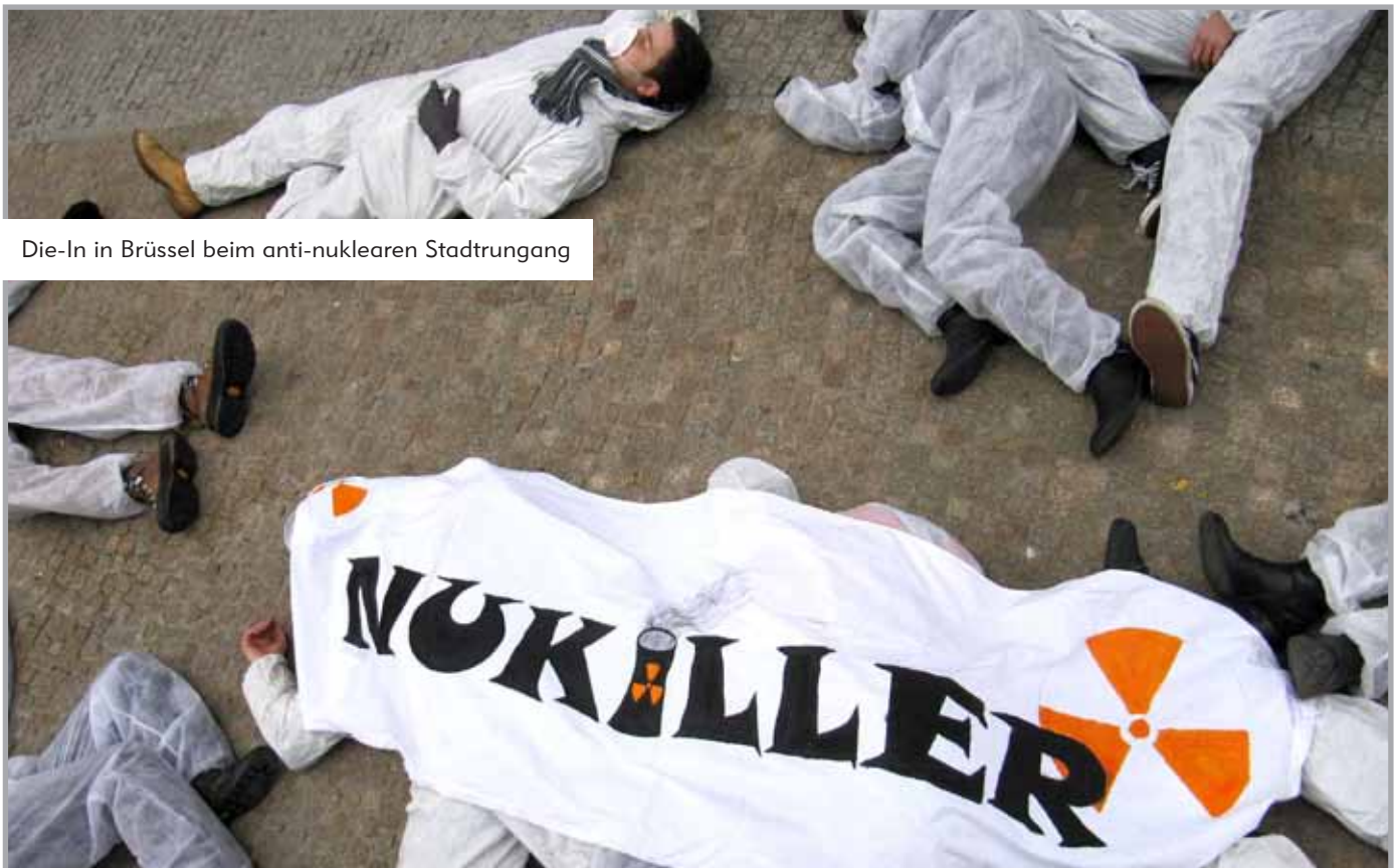
Die-In in Brüssel beim anti-nuklearen Stadtrundgang